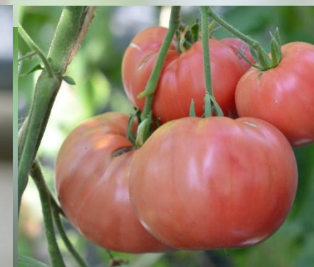
255 Olena Ukraina