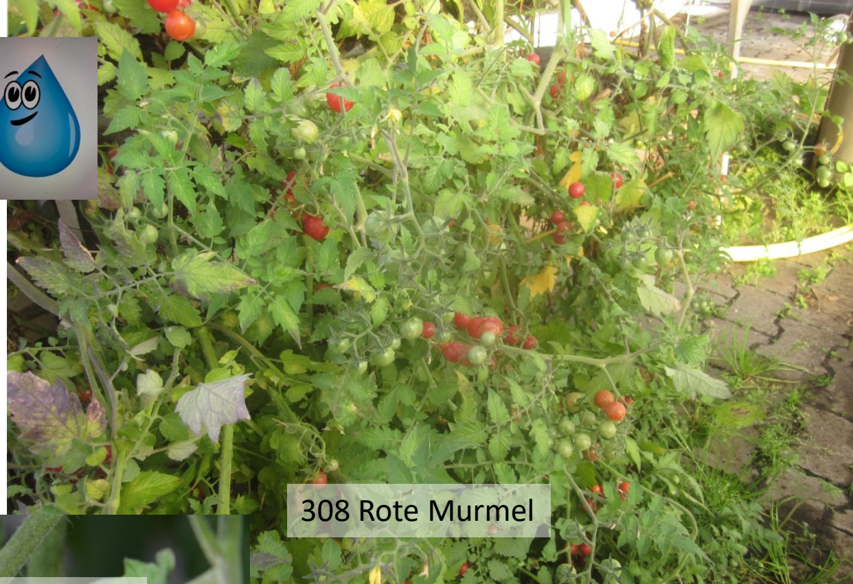
308 Rote Murrel