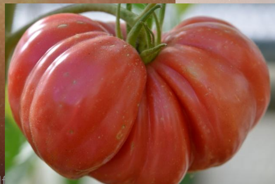
752 Mother Russia