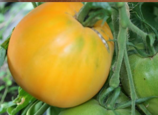
30 Solotoije Königsberg