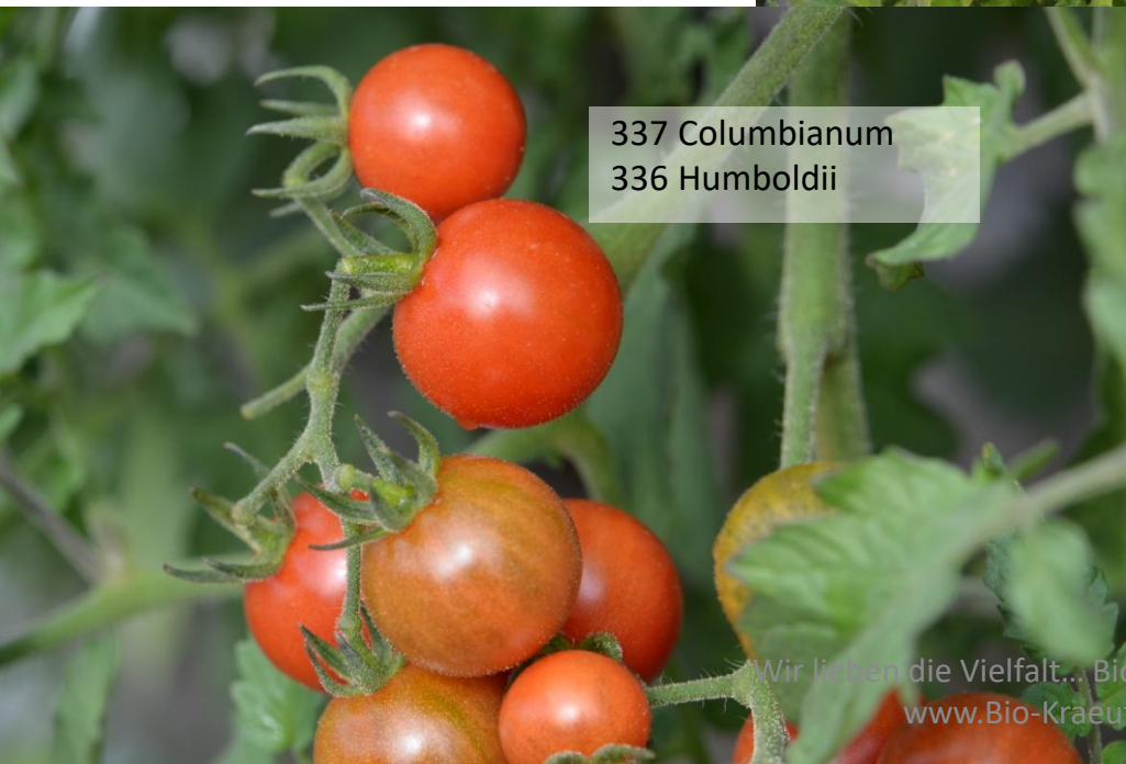
337 Columbianum 336 Humboldtii